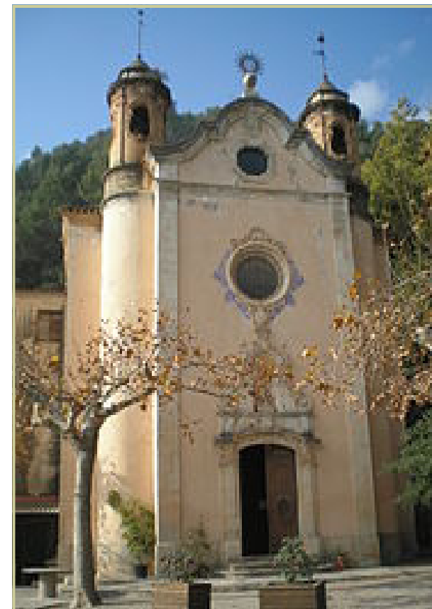
ARXIPRESTAT DE L'ALT CAMP ARQUEBISBAT DE TARRAGONA